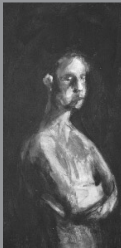
Figure avec les bras croisés